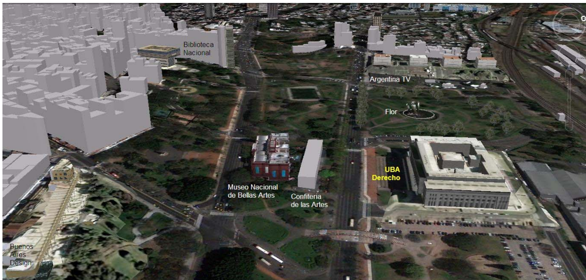
Vista de la zona