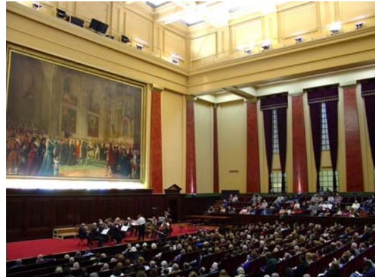
Salón de actos